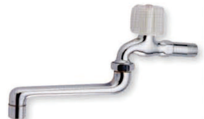
● 6704 新B自由栓 1/2"