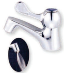
● 6694F 陶瓷省水立栓