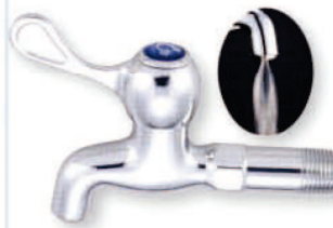
● 6693F 陶瓷省水長栓