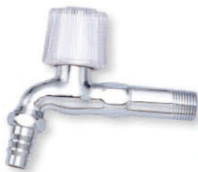
● 6701B 新B皮管長栓 1/2" 3/4"