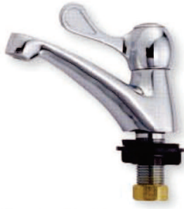
● 6694 單把手立栓(皮心)(陶瓷) 1/2" 管加長 1/2"