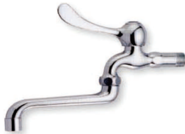
● 6695 單把手自由栓(皮心)(陶瓷) 1/2" 3/4"