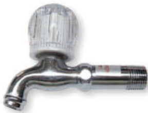
● 6701A 專利新A長栓1/2"