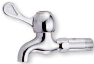
● 6693 單把手長栓(皮心)(陶瓷) 1/2" 3/4" 1/2" (ST)