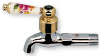
● 6690 陶瓷彩繪長栓 1/2" 3/4"