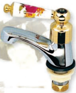
● 6691 陶瓷彩繪立栓 1/2"