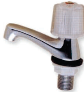
● 6702 新B立栓 1/2"