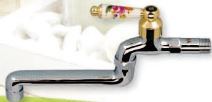
● 6692 陶瓷彩繪自由栓 1/2" 3/4"