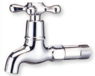
● 6693A 十字陶瓷長栓1/2"