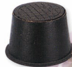
● 6808 鑄銑凡而箱