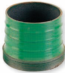
● 6614 銑接管