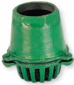
● 6613 長形福特凡而