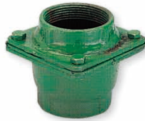
● 6615 銑四角中間凡而