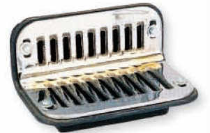
● 6806 牆角落水