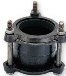
● 6617 伸縮接頭