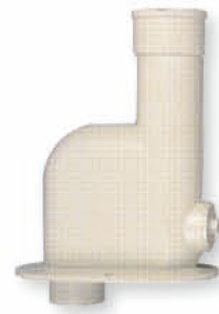
● 6803 拖布盆 S 管