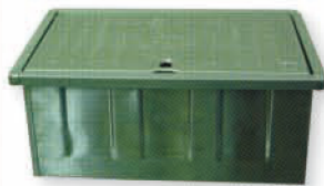
● 6676 ST水表箱