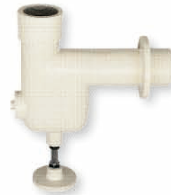
● 6804 拖布盆 P 管