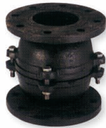
● 6624 F 式中間