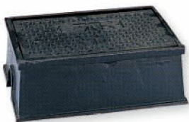
● 6621 鑄銑水表箱