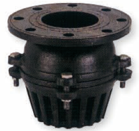
● 6622 F 式福特